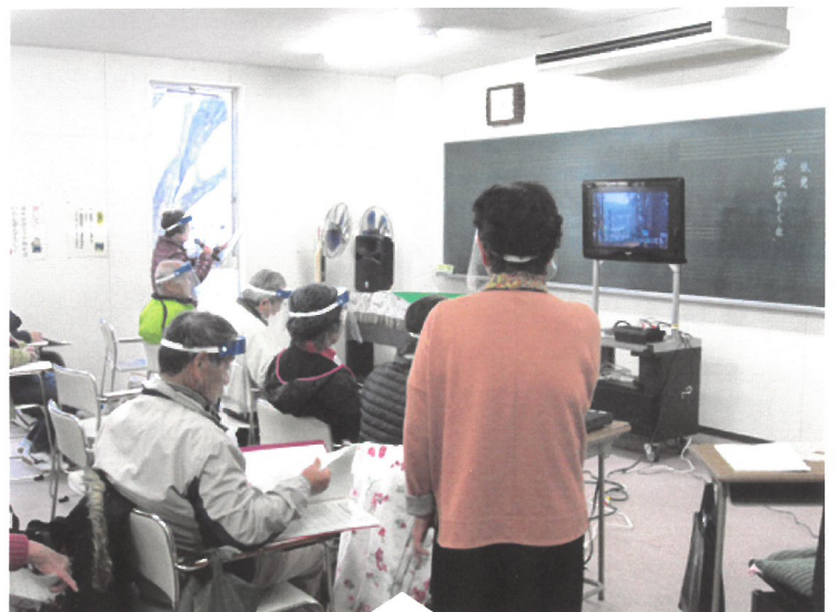
フェイスシールド越し、気持ちを込めて歌います!!