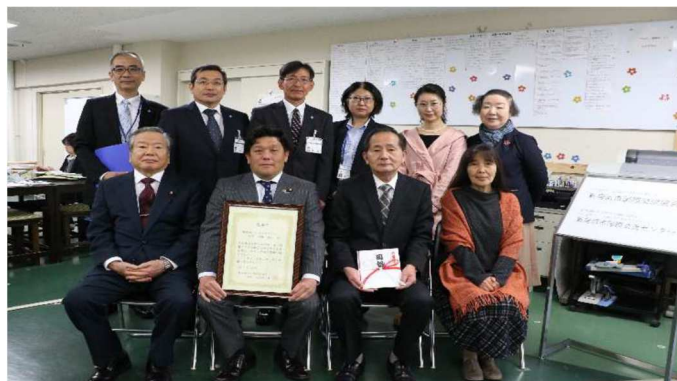
オープンセレモニー参加者