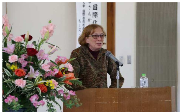
愛媛大学のルース先生のご講演