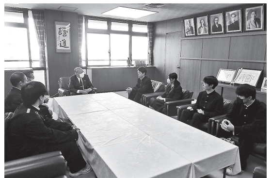
生徒代表の6人が議長室を訪れました

傍聴終了後、代表生徒が議長室を訪れ、正副議長にあいさつし、「自分たちの生活に関わる質問があり身近に感じることができた」など、傍聴した感想を述べました。