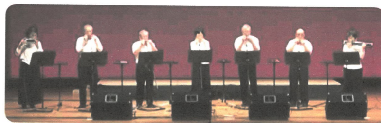
旧名 アルカディアの皆さん