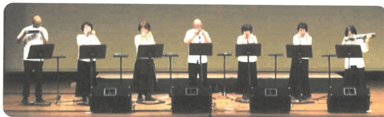
旧名 コンテニューの皆さん