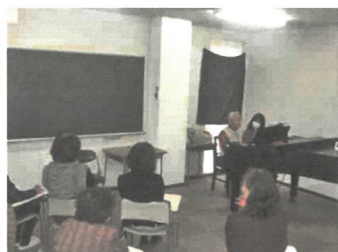
「メヌエット」練習風景