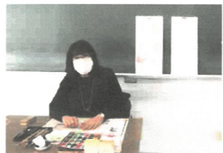
講師の先生と 絵手紙ひよこの皆さん