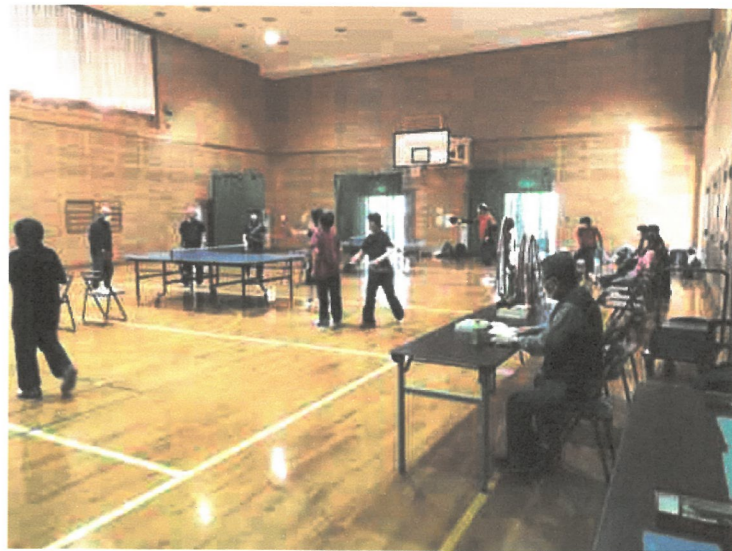
優勝を競い合う「桃山C杯」大会の様子

来年度においては、高齢による免許証の返納、長距離運転の困難、親族の介護、自身の体力の限界等々の理由で退会される方が多く見込まれます。伝統ある「桃山C杯」の存続が危ぶまれる非