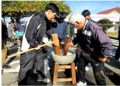
合同セミナー 『三世代交流 もちつき大会』

令和5年度は、4年ぶりに様々なイベントが復活し、賑やかな公民館活動が実施できました。皆様のご支援ご協力のもと、公民館事業（講座・イベント等）に多数のご参加、ご利用をいただきましてありがとうございました。 来年度も皆さんにとっての「サードプレイス」（自宅や学校、職場以外の居心地の良い第3の場所）になるような、公民館づくり・公民館活動を行っていきたく考えています。何卒よろしくお願いたします。