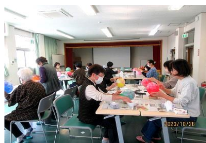
手作りセミナー 『ランプシェードづくり』