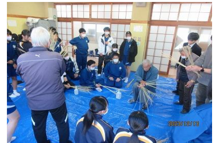
地域学校協働本部事業 『中学生ふるさと学習』