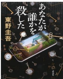
「あなたが誰かを殺した」 東野 圭吾 著

◆加賀恭一郎シリーズ最新刊。閑静な別荘地で起きた連続殺人事件。愛する家族が奪われたのは偶然か、必然か。