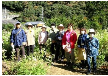
いき生き生活セミナー 『地域探訪～立川編～』