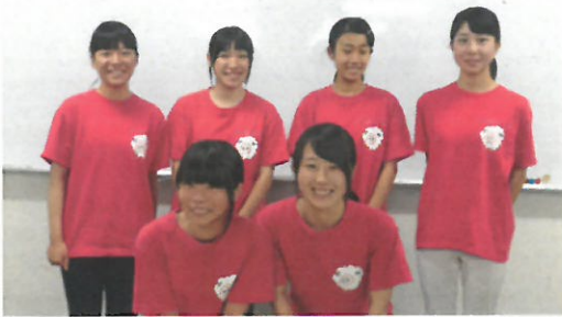
高校生ボランティアサークルMay