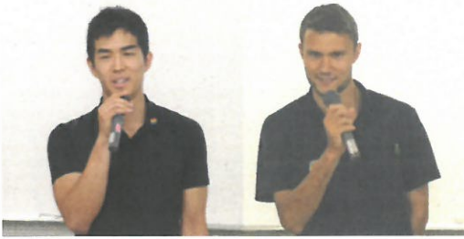
スコット先生 ジェイソン先生