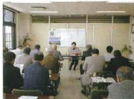
それぞれの研修先で活発な意見交換を行いました。