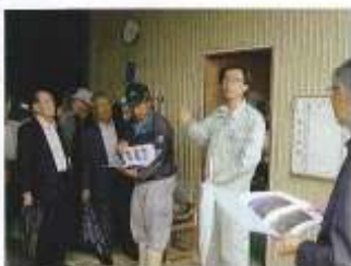
新居敷未来農業の取組みについて、熱心に聞き入る委員

◇代表者の人柄が良さそうであり、他の組合員との関係も良好であるように感じた。農機具等も見学したが、大型機械を取り入れ合庫事業所も備え良好な環境であると思った。 ◇「農事組合法人 當麻の家」は、平成七年四月日より農事組合法人當麻町特産加工組合が當麻町と管理委託契約を締結し施設を独立採算で運営しており、その後、農家と農協の出資金九二〇万円で平成