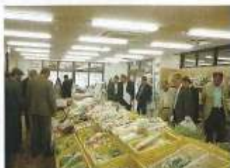
「當麻の家」の地元農産物売り場は、平日にもかかわらず大盛況でした。

七年二月に設立し、平成十二年に、農協からの出資金を返し増資し、平成十八年四月より指定管理者に指定されたようですが、レストランで郷土食を作ったり、加工食品がたくさんあり、まさに安心旬の味として當麻の家が運営されている。 ◇何といっても、消費者にとり、魅力あるものを提供することが、店舗の繁盛につながり、売り上げも向上すると思っています。本市の農産物直売所「あかがね市四季菜広場」ももう少し消費者のニーズにあつた魅力的な加工品や農産物を提供するべきであると感じました。 ◇平日であったが、来客も多く賑わっており、遠方からの客も多く来ていた。レストランの食事も地元の農産物を使用した健康志向であった。 ◇この施設は、農産物、加工品、食卓と三位一体型の経営で主婚のパートナーは、九〇%で地域の働き場所となっており、従業員は大変喜んで働いています。 ◇各様の体験を通じての地域住民の交流、子どもたちへの食農教育、収穫の喜び等体験には楽しいものがある。出品物の新鮮な野菜は少ないが、本市の「あかがね市四季菜広場」も加工品を多く取り入れる必要があろうかと思われた。