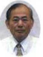
白旗 愛一 清水 町 農地部会