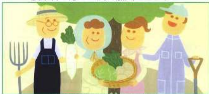
「担い手積立年金」は農業者年金の愛称です。