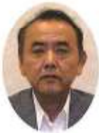
星加 武比古 中西 町 農地部会