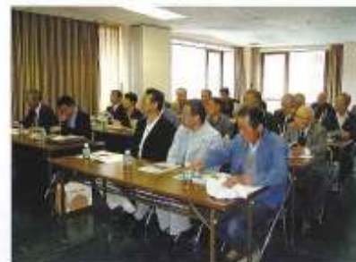
研修を真剣に聞く委員達

★新居浜市農業に少しでも貢献し、努力していかなければならないことを痛切に感じました。