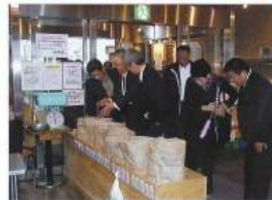
近江米のコーナーを熱心に見ている委員達

近江米を中心とした、地場農産物の販売等を行っている。平成18年4月から指定管理者として㈱小杉農園が管理運営している。