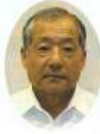
河端 廣 宮原 町 農政部会