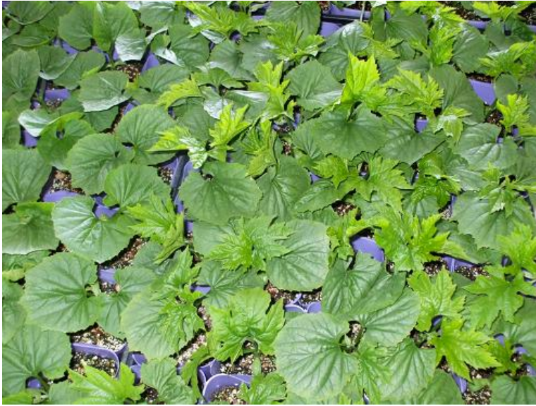
<栽培モニターにお渡ししたゴーヤの苗>