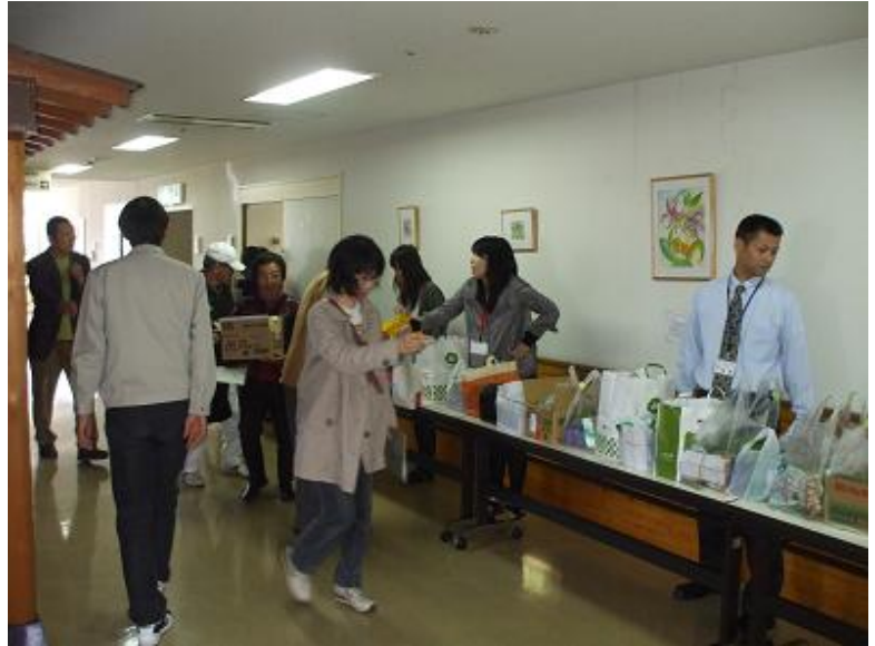
<モニターへの配布の様子>