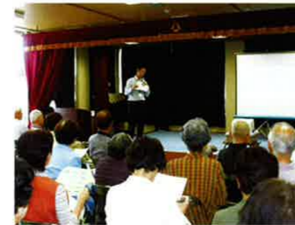
エコドライブ講習の様子