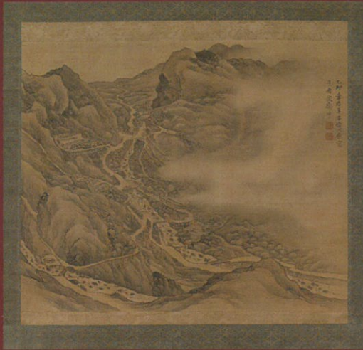
別子銅山図 寛政7年(1795)住友史料館所蔵 江戸時代中期の儒学者皆川淇園によって描かれた別子銅山図。