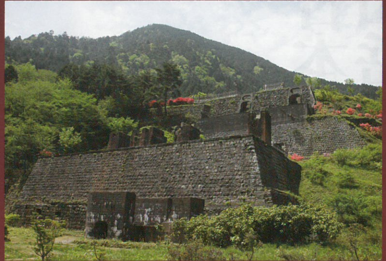
東平選鉱所・貯鉱庫・索道停車場跡