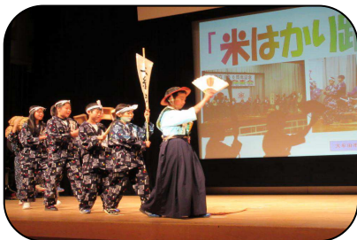
玉川小学校「米はかり踊り」

「国際理解教育」「地域歴史文化理解教育」「武蔵台ESD」の三つのテーマに分かれて学習し、郷土の歴史・文化について誇りをもって語れる生徒や地域に何ができるかを考える生徒の育成に努めています。