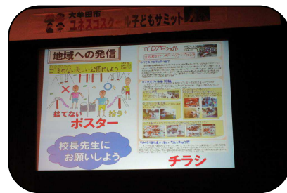
高取小学校「TCDプロジェクト」