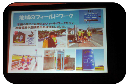
興除中学校「フィールドワーク」

高取校区クリーン&ドリームタウンプロジェクトを通して、自分たちの力でゴミのない美しい公園の実現に尽力しています。