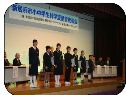
特選受賞者のみなさん