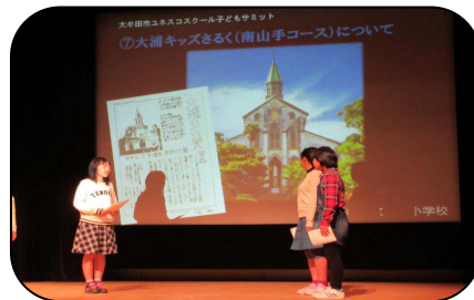
大浦小学校「観光ガイド」