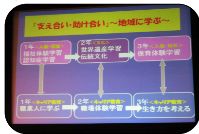
橘中学校「大牟田100年物語」