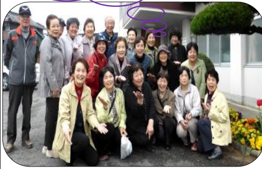
～ 新居浜市役所 環境保全課より ～