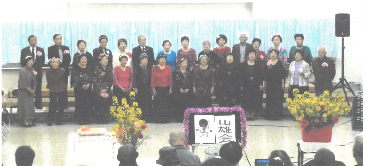
学園祭における公演部の発表風景