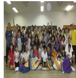
わくわく通学合宿 I N新居浜公民館