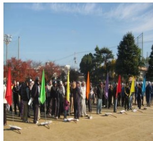
地域自主防災組織の強化 校区全体避難防災訓練