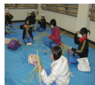
三世代交流事業 餅つき・しめ縄・凧作り