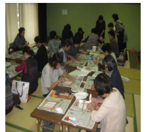
女性講座年7回実施 様々な講座を開催