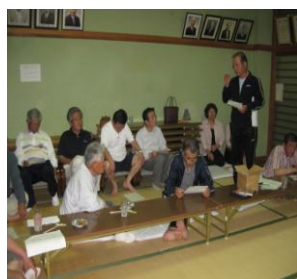
団塊の世代 シニアネットワーク

この他に、なかよし教室・えんぜるっこ・新小夜市などの事業を行いました。新事業も加え、多くの方々の参加、協力により、成果ある活動ができました事、感謝しております。今後共、よろしくお願ひいたします。