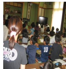
小学生夏休み講座 宿題デー・絵画・PC