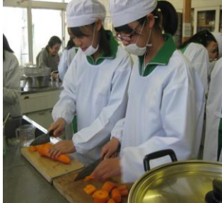
小・中学生料理教室 各・年4回実施