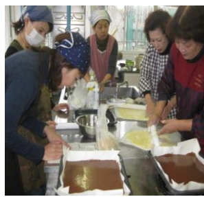
地域活性化事業 つづら淵の水を使って