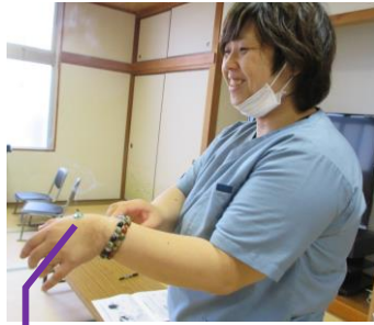
肩こりに効くツボ(合谷)にお灸

手足のツボにマジックで印をつけたため、帰ってからもお灸を続けている人がいるそうです。体調がよくなりますように。