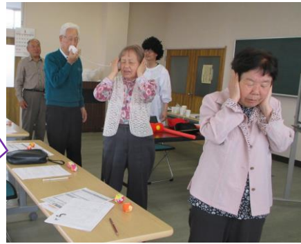
先生お手製の糸電話を使って伝言ゲーム。きちんと最後まで伝えるか、お楽しみですよ。