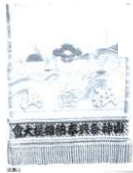
祇園山の 化粧まわし