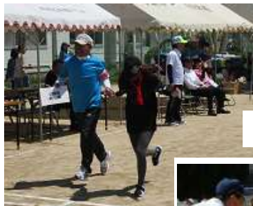
柴田館長も神郷小 高須賀校長先生も 大活躍です！