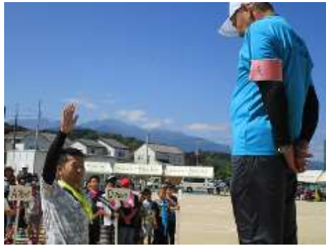
力強い選手宣誓で始まりました

最後になりましたが、中学生の皆さんの運動会での進行補助、アソカ園職員さんの救護のお手伝いありがとうございました。