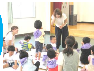
いきいきコーラス