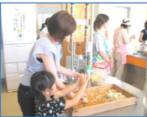
味噌じゅりに挑戦