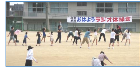
おはようラジオ体操