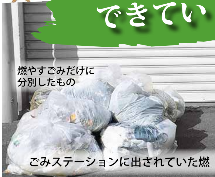
燃やすごみだけに分別したもの