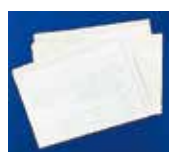
学校のプリントなどの用紙類

※ティッシュ・お菓子の箱や封筒、説明書などの雑がみは、紙袋に入れてひもでしばると散らばらず資源としてリサイクルできます。