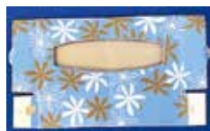
ティッシュペーパーの箱