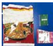
即席めんなどの外袋とスープの素や薬味などの内袋