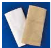
トイレトペーパーの芯