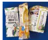
ペットボトルや調味料のラベル