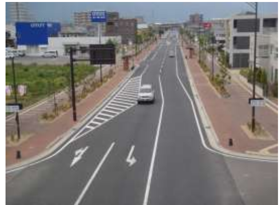
【無電柱化されたシンボルロード】