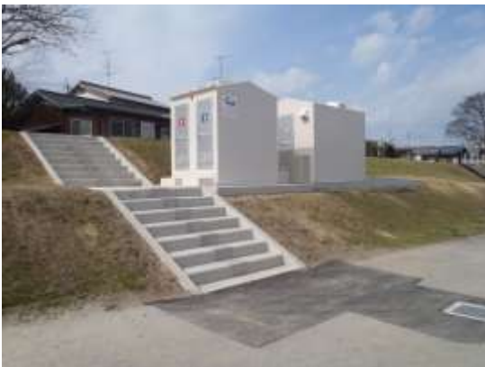
【国領川河川敷に整備されたトイレ】