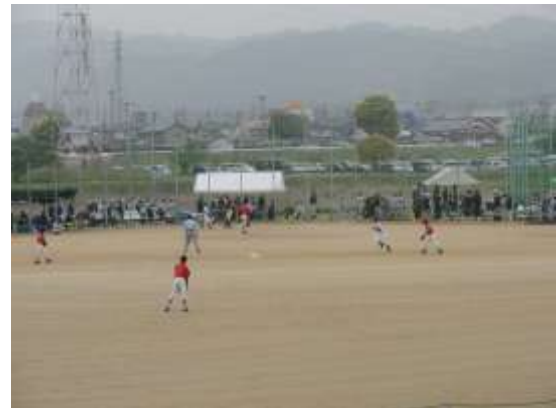
【バックネットが整備されたソフトボール場】