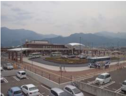
【生まれ変わった駅前広場】