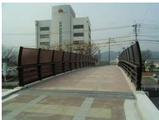
【完成した中央環状線自転車歩行者道】