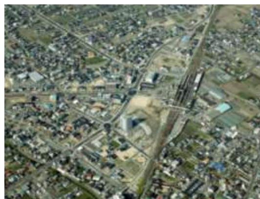
【駅前土地区画整理事業施行中・平成 22 年 4 月】