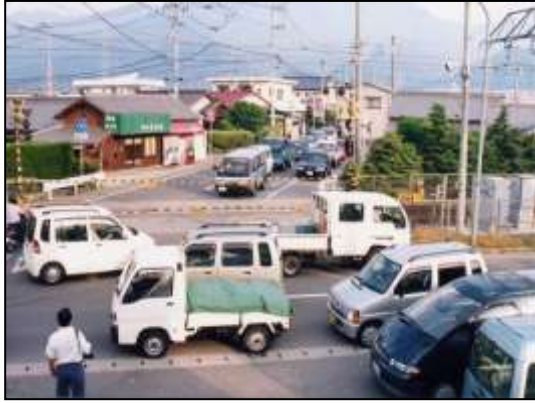
【踏切遮断による交通渋滞】