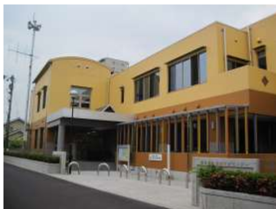
【地域交流センター】