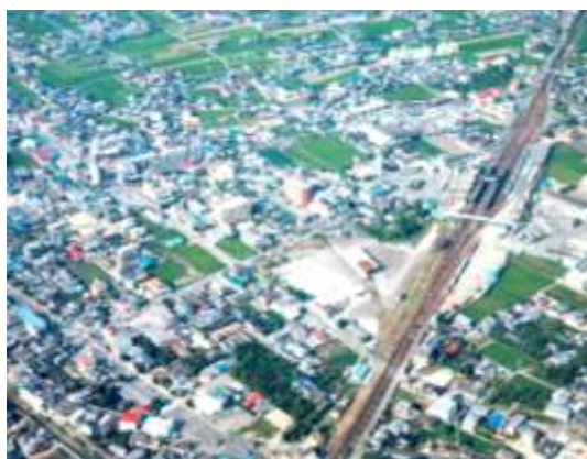
【駅前土地区画整理事業施行前・昭和 63 年 9 月】