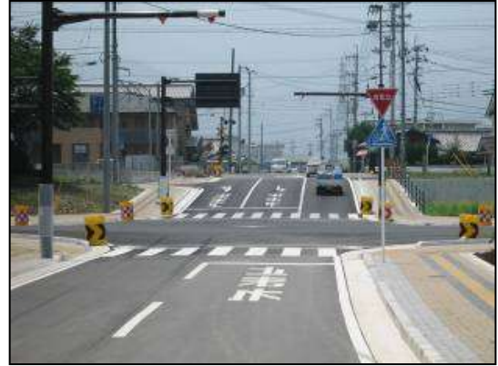
【交通渋滞が緩和された第1踏切付近】