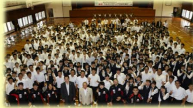
日本代表チームによる「オリンピック交流事業」