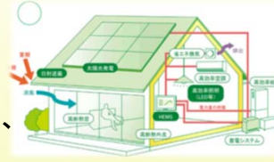
ZEH(ゼロ・エネルギー・ハウス)