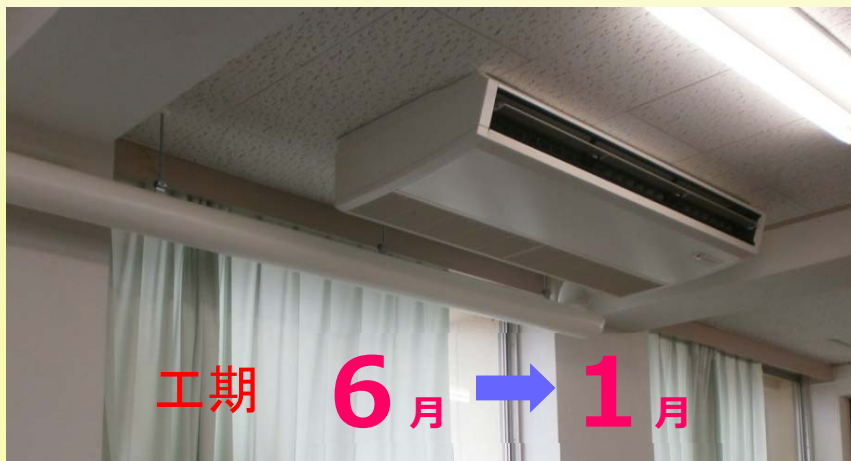
整備されたエアコン(イメージ)