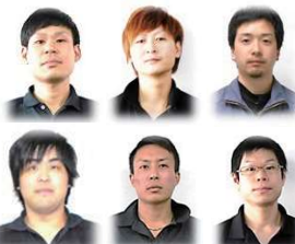
次世代の担い手となる若者達です。

明るく、素直な人が活躍しています。明るく挨拶ができて、素直な吸収力がある人はどんどん技術を身に付けています。 今、活躍している人たちも未経験からスタートした人がほとんどですから、安心して飛び込んでみて下さい。しっかり受け止めます。