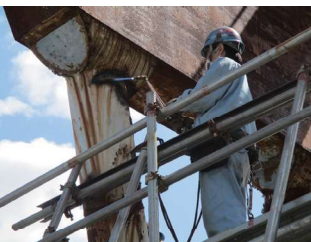
鉄工部の作業から