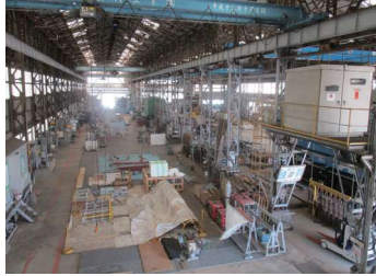
山内工業(株)本社と本社工場