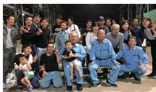
本社工場にて懇親会

機械いじり、物造りに興味のある人。明るく元気よくあいさつのできる人。私たちと一緒に楽しく仕事をしませんか！ 30～40代の技術のすぐれた作業長・職人が多く、お客様の安定操業を支えるという使命のもと日々皆で切磋琢磨しています。