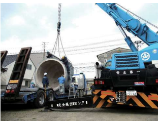
重機部の作業から

主に、住友グループ工場内で補修工事を行っている会社です。具体的には、配管の製作を始め解体及び取付、機械類(ポンプ、ブロワー等)の補修、クレーンを使用しての重量物の移設、また足場の架設、製缶及びタンク等、工場内の設備機械を製作しています。