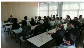
外部講師を招いての社内安全品質協議会

高い技術力と経験を誇るわが社の一員として一緒に働きませんか。新しい時代へ向かって大きく羽ばたく当社では、やる気と情熱を持って仕事に取り組める若者を大募集しています。若手社員への安心の充実した教育制度があります。