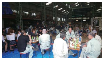
社内バーベキューの様子