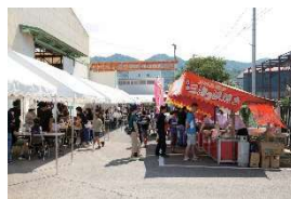
オープンファクトリー