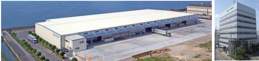
2017年に新設された物流センター／本社ビル

〒792-0893 新居浜市多喜浜6-8-33 (四国支社) TEL 0897-45-0138 (代表・採用担当) FAX 0897-46-2520 Web ページ https://www.ichimiya.co.jp/tran/ E-Mail sakamoto_chihiro@unnyu.ichimiya.co.jp