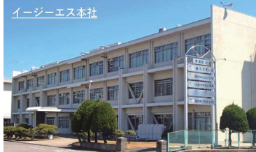
イージーエス本社