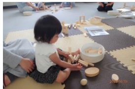
子育て支援セミナー (メルヘンクラブ)

校区の皆さまには、公民館活動にご協力をいただきまして有難うございました。令和2年度は、新型コロナウイルス感染症対策で公民館の使用出来ない等で、十分な活動ができませんでした。令和3年度はコロナ感染症対策をしながら、安心して参加していただける様に、取り組みたいと思いますのでご協力お願いいたします。ご意見、ご要望などありましたら、是非公民館までお寄せください。