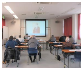
郷土の歴史と文化 (近藤篤山について)