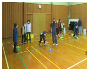
スポーツ健康教室 (カラーリング大会)