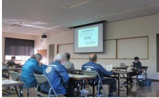
タイムリーな健康情報を学んで地域に発信します！