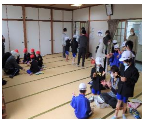
三世代交流事業 (昔あそび)