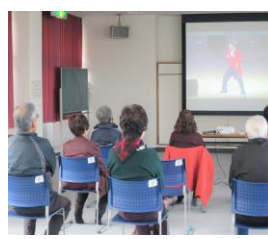
高齢者いきいきセミナー (映写会)