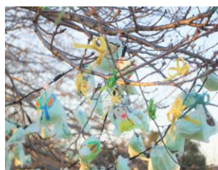
大生院校区まちづくり事業 (イルミネーション点灯)