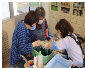
くらしのセミナー (藍染め)