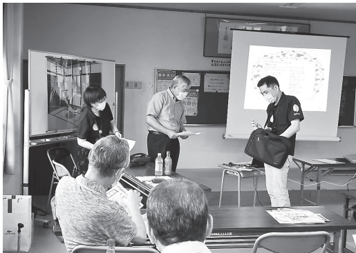
悪質商法にご用心