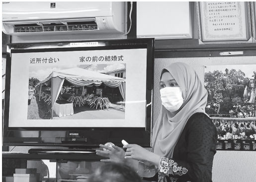
マレーシアの魅力を探ろう！