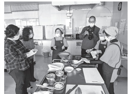
4月に新居浜市食生活改善推進協議会が郷土料理「いずみや」で雑誌「dancyu」の取材を受けました。