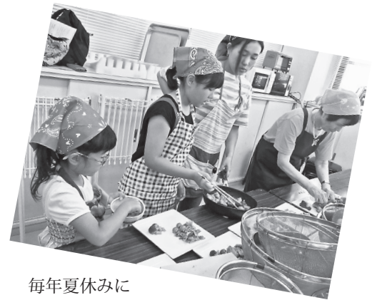
毎年夏休みに開催している親子料理教室。親子で食の楽しさやおいしく安全な食べ方などを学びました。

近年、ライフスタイルの変化に伴い、「朝食をとらない」「不規則な食事」「栄養の偏り」などの食生活の乱れにより、生活習慣病や肥満の増加などの問題が生じています。国では、6月を食育月間、毎月19日を食育の日と定め、「食育」を推進しています。