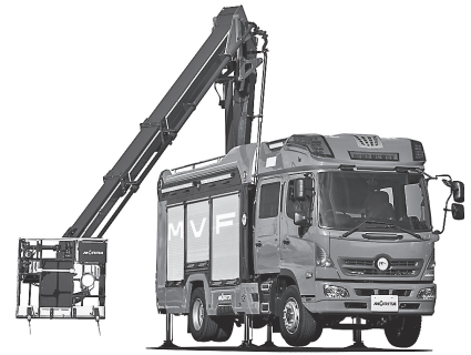
多目的消防ポンプ自動車