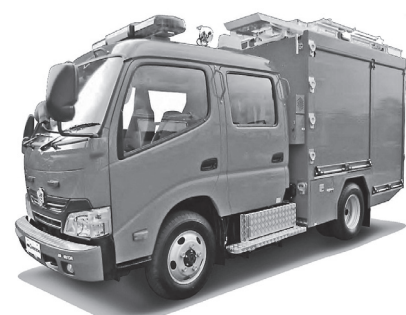
消防ポンプ自動車 (CD-1型)