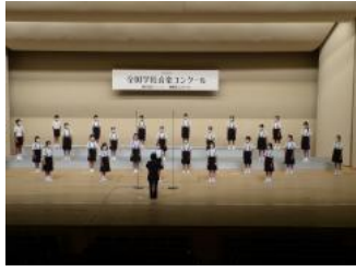
高津小合唱部の皆さん