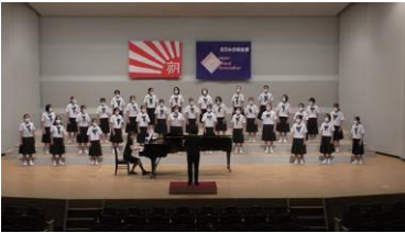
東中音楽部の皆さん