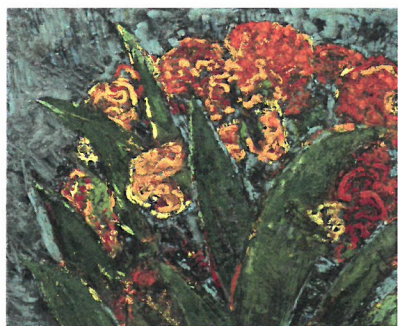
カンナ 30号F 2017年 部分

2000年以降 広島への取材を重ねて完成した 矢野 美代子 後半生をかけた渾身の「原爆シリーズ」