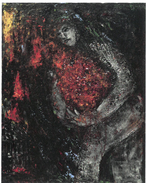
生命の華 30号F 2020年