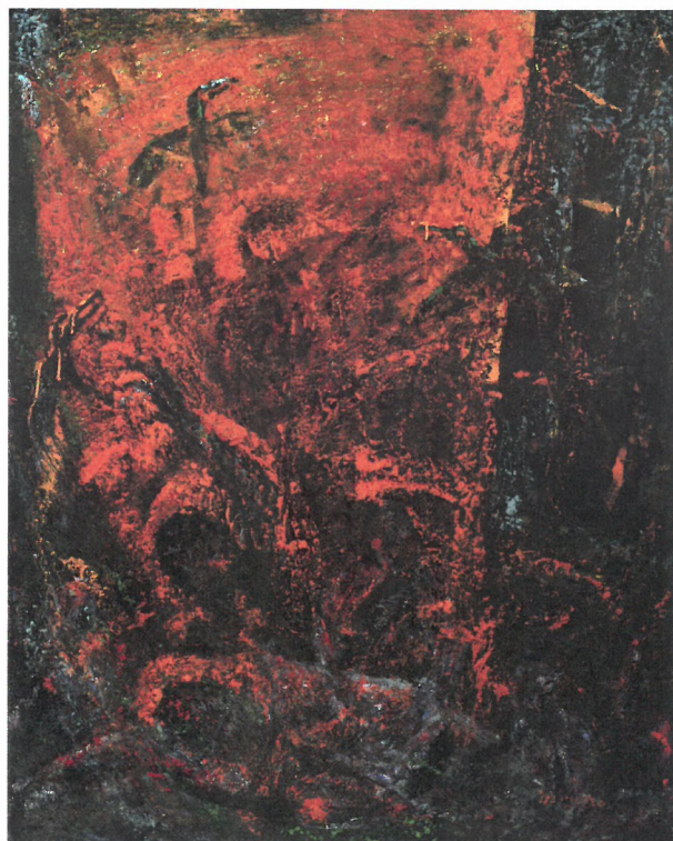
墜落 100号F 2013年