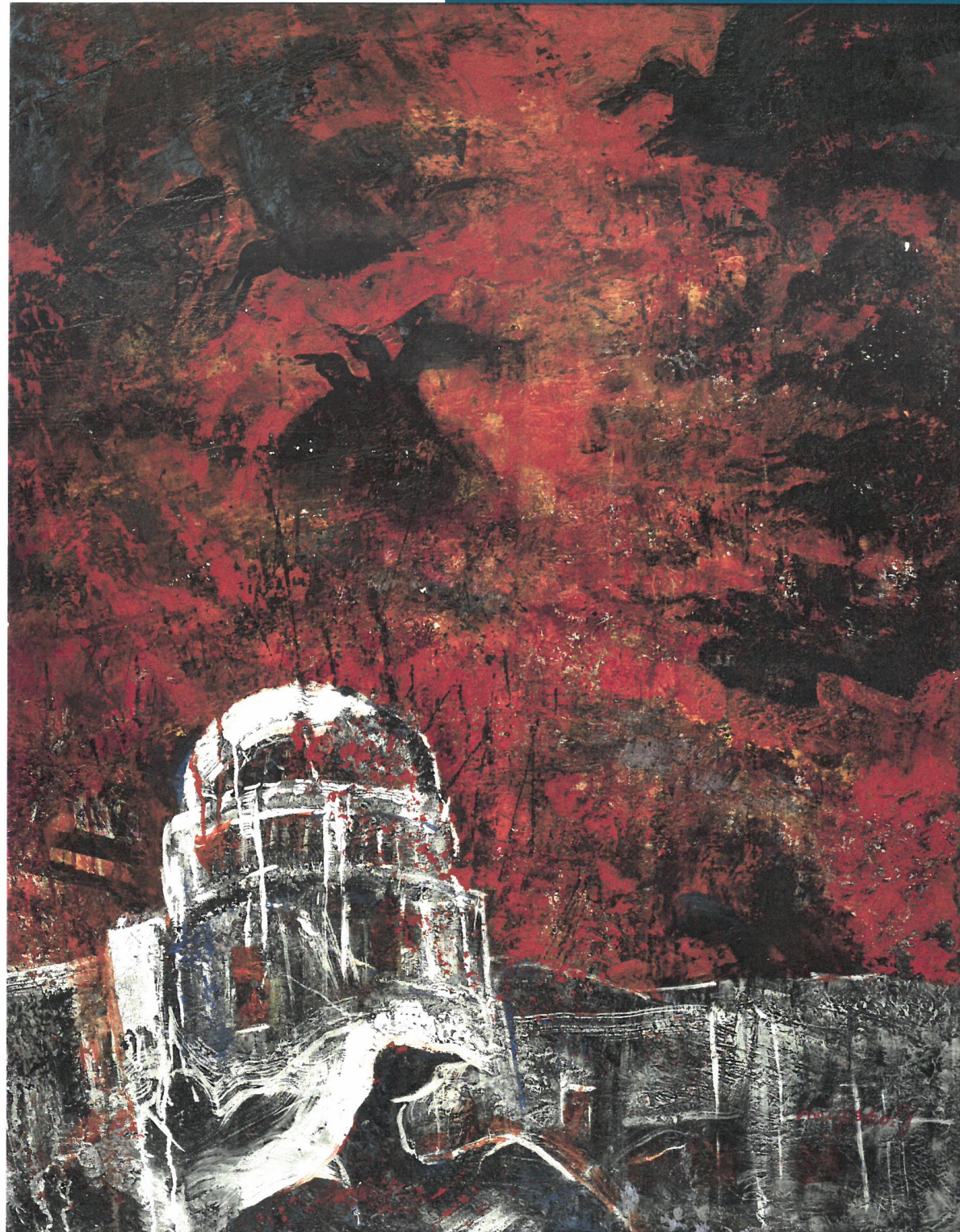
原爆 50号F 2013年