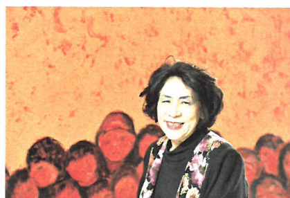
母と子 50号P 2007年

鬼灯をひとつくたさ 口に含んで鳴らしま あの子のために鳴 名前も知らないあ 父を忘れたあ