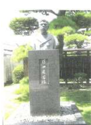
藤田家庭園にある氏の胸像

あらためて、明治時代政界において実績を残した郷土神郷出身の衆議院議員藤田達芳について