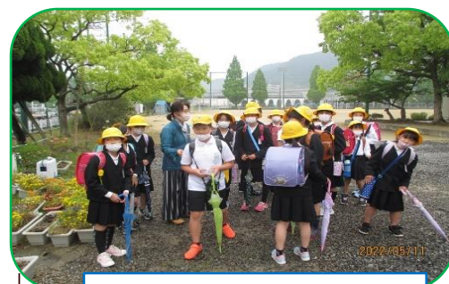
惣開小にお迎え、一緒に移動