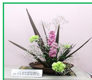
ロビーを飾る「井下生け花教室」