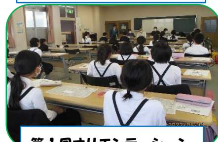
第1回オリエンテーション