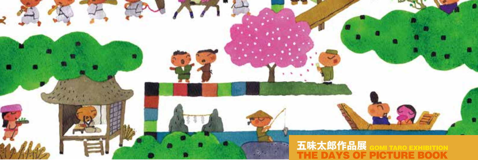
「百人一首ワンダーランド」2014 東京書籍