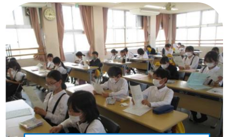
第1回オリエンテーション