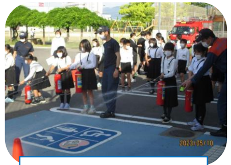
消防避難訓練・消火器訓練