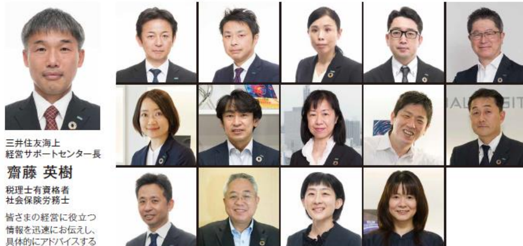
三井住友海上 経営サポートセンター長