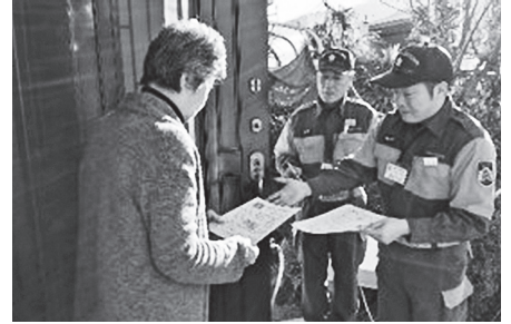
一般家庭の防火診断の様子

一般家庭の防火診断は、10月下旬から11月中旬をめどに実施します。消防団員が住宅を訪問し、 命 を守るための防火・防災に関する質問やアドバイスをします。消防団員は調査員証を携行していますので、ご理解とご協力をよろしくお願ひします。なお不在時は、火災予防運動などに関するチラシをポストに投函しますのでご覧ください。