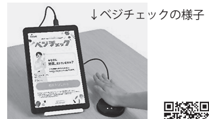
↓ベジチェックの様子