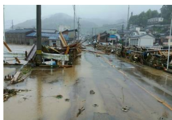
×路上に置かれた片付けごみ