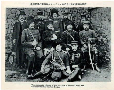
乃木希典・ステッセル会見写真

右の写真は、明治37(1904)年2月29日から翌年8月5日までに、新居郡役所から郡内各村へ送付された日露戦争の戦況報告です。沈没艦船や死傷者数・捕虜人数のことなどが詳細に記され、地方自治体に戦地の情報が逐一共有されていたことが分かります。