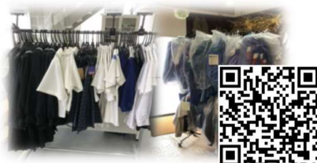
制服リユース（アゴラリユース東予）