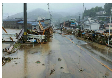
×路上に置かれた片付けごみ