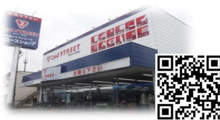
セカンドストリート新居浜店