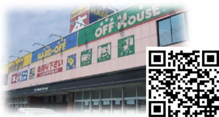
エコタウン新居浜西喜光地店 (ブックオフ・ハードオフ・オフハウス・ホビーオフ)

新居浜市では、まだ使用できる品物を「ごみ」とせず繰り返し使う「リユース（再利用）」を促進するため、中古品、古着などの引取り、販売、製品の修理（家具、家電、自転車など）を行っているリサイクルショップ等を紹介しています。ごみとして処分する前に、市内のリサイクルショップのご利用を検討してみましょう！