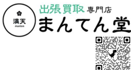
まんてん堂新居浜店