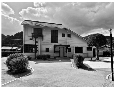
外国人技師西社宅