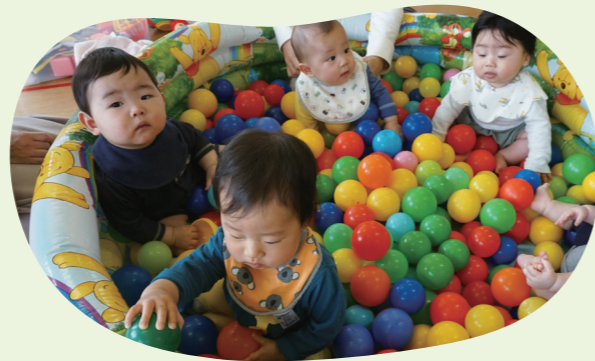
ボールプールで、みんな楽しくあそんだよ♪