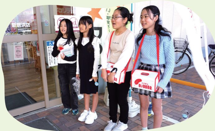
ジュニアリーダークラブは、いろいろなボランティア活動に参加しています。