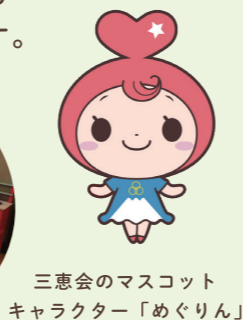
三恵会のマスコットキャラクター「めぐりん」