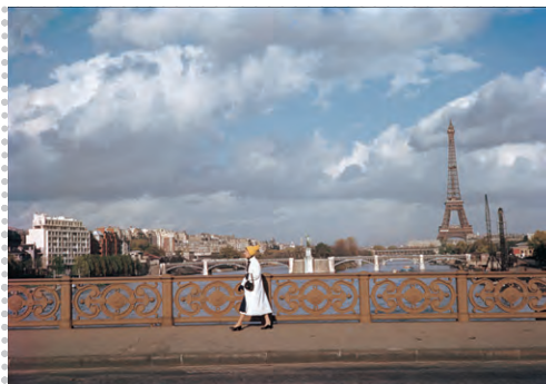
ミラボー橋、パリ、フランス、1955年