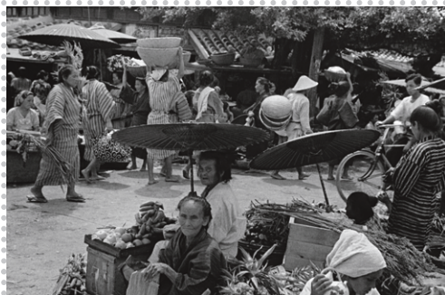
那覇の市場、本通り、沖縄、1936年