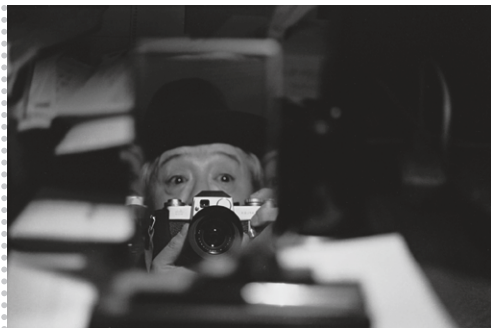
ライカを構える木村伊兵衛自画像、1965年