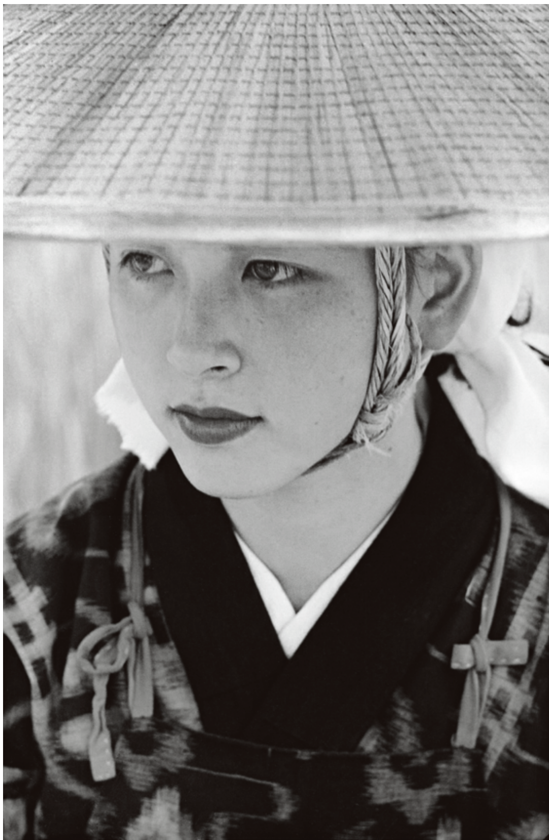
秋田おぼこ、大曲、秋田、1953年