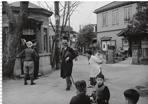
本郷森川町、東京、1953年