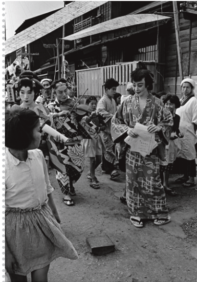
町廻り、佃島界隈、東京、1953年