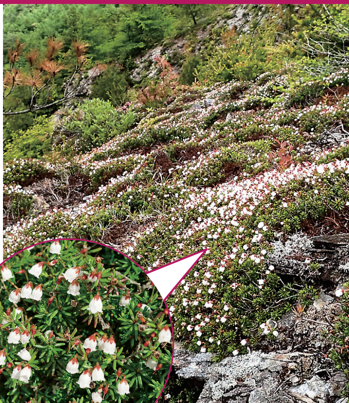
群生するツガザクラ

しかし近年、減少が続いています。原因は地球温暖化によって他の植物が生育したことで生育域を追われたことや、登山者や動物による踏圧被害、シカやイノシシなどによる食害や掘り起こしなどが考えられています。