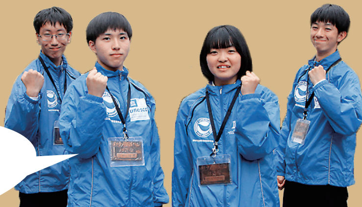
南高校で中心になって保護活動を行っている皆さん