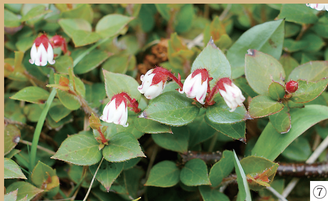
①②アケボノツツジ ③キンラン ④マルバウツギ ⑤ユキモチソウ ⑥ムラサキサギゴケ ⑦アカモノ