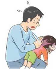
図1: 背部叩打法 (幼児)