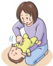
図4: 胸部突き上げ法 (乳児)