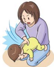
図3: 背部叩打法 (乳児)