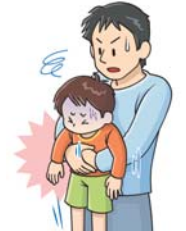
図2: 腹部突き上げ法 (幼児)