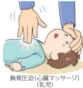
胸骨圧迫(心臓マッサージ) (乳児)