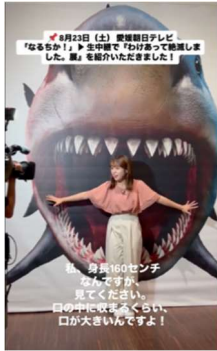
わけあって絶滅しました。展