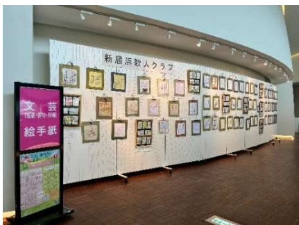
にいほま春の市民文化祭