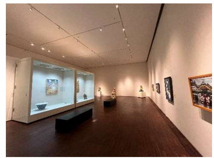
愛媛県展新居浜移動