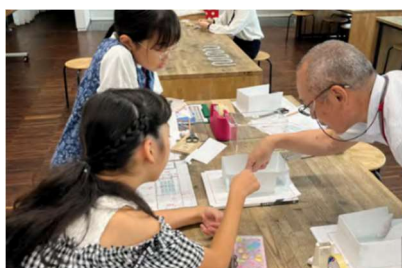
あかがねジュニア学芸員