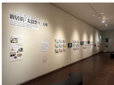
新居浜太鼓祭り展「煌きの太鼓台」