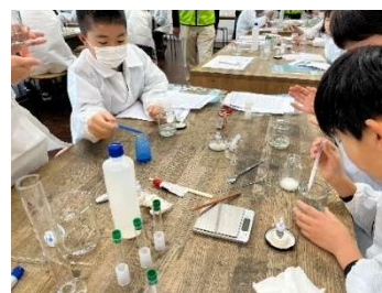
あかがね理科クラブ