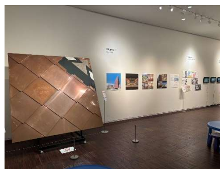
FAN! FUN! にはま

(エ) 太鼓台ミュージアム (主催事業) 4件 入館者数実績 14,814人 (目標人数) 30,000人