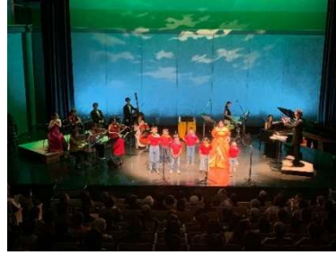
瀬戸フィルオーケストラ公演