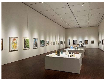
新居浜市美術展覧会