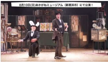
おとぎと魔法の劇場