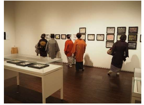
企画展 ボタンデザイン